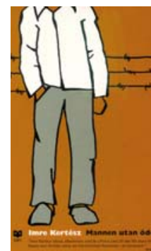
Mannen utan öde av nobelpristagaren Imre Kertész.

Forum för levande historia Utställningar, workshops och föredrag.