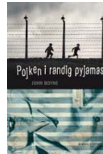
Pojken i randig pyjamas av John Boyne.