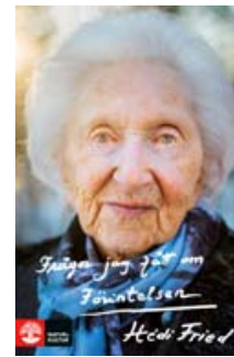
Frågor jag fått om Förintelsen av Hédi Fried.