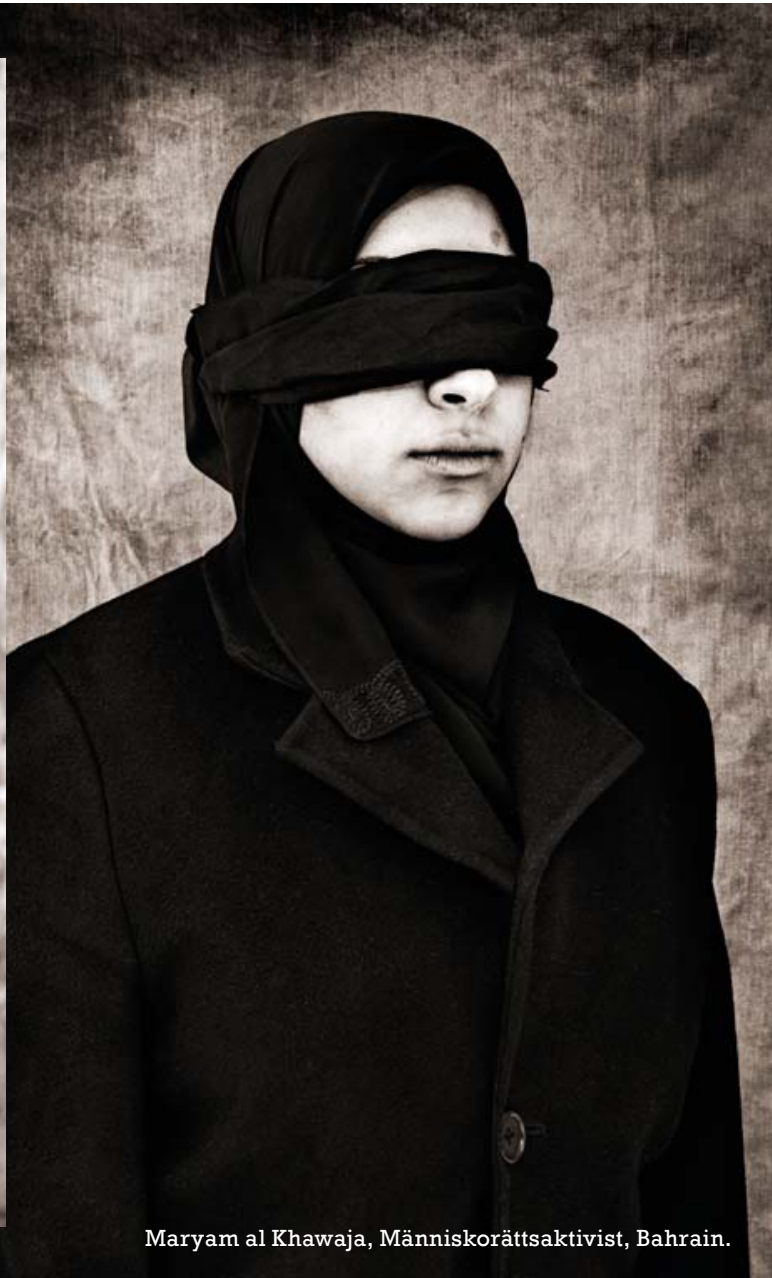
Maryam al Khawaja, Människorättsaktivist, Bahrain.