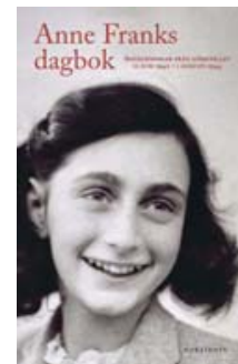
Anne Franks dagbok av Anne Frank.