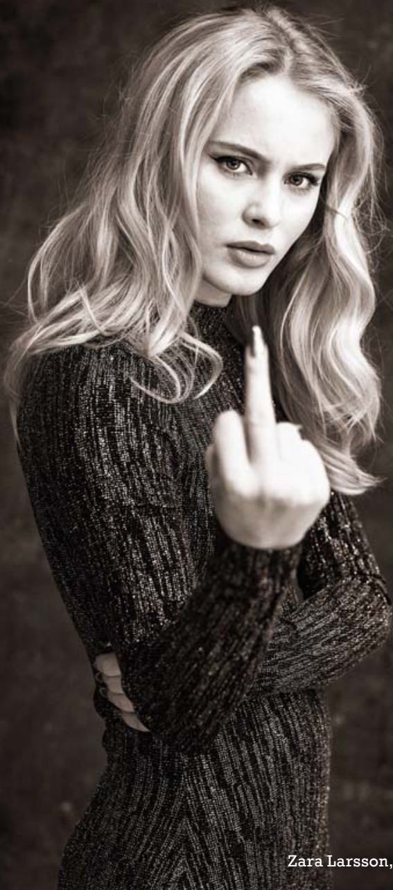
Zara Larsson, Artist, Sverige.